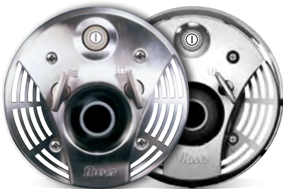
Abb.: Edelstahl matt oder glänzend