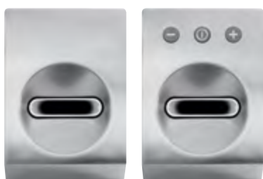
Abb.: X-jet mit 160 m 3 /h