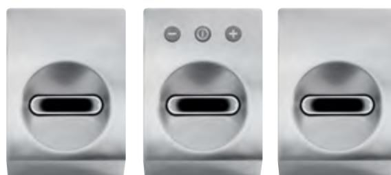
Abb.: X-jet mit 240 m 3 /h